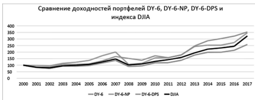
Рис. 3. Доходность портфелей на основе роста дивидендной доходности

феля DY-6 (на основе роста дивидендной доходности за шесть месяцев) за весь период составила 247% по сравнению с 229% рыночной доходности, при этом использование фильтров на основе EBITDA, Net profit и Debt per share показало результаты в 242, 257 и 257% соответственно. Результаты работы фильтров для портфеля DY-6 с декабрем в качестве контрольного месяца показаны на графике.